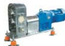
POMPA DO MAS GĘSTYCH